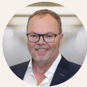
Frédéric Gross Grisoni-Zaugg SA