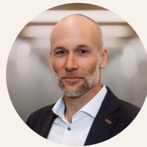
Andreas Reber Marti Tunnel AG