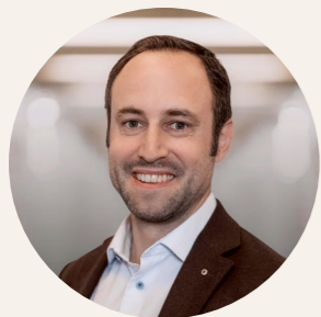
Christian Wasserfallen Präsident | Nationalrat

Der Vorstand von Infra Suisse setzt sich aus erfahrenen Branchenvertretern zusammen und gewährleistet eine ausgewogene Vertretung der Mitgliedsfirmen nach Tätigkeitsgebiet, Region und Firmengrösse. Die Vorstandsmitglieder tragen die Verantwortung für die Fachbereiche und Ressorts. Dabei bringen sie ihr Fachwissen gezielt in die Verbandsarbeit ein.